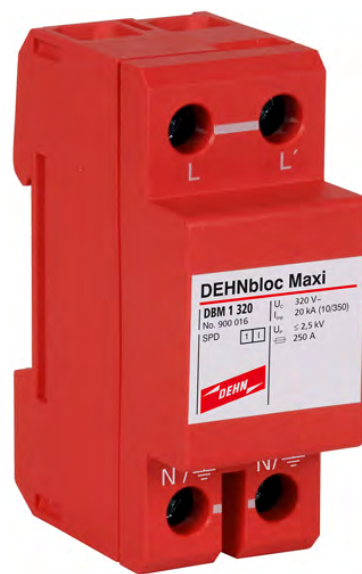
DBM 1 320 nr kat. 900 016