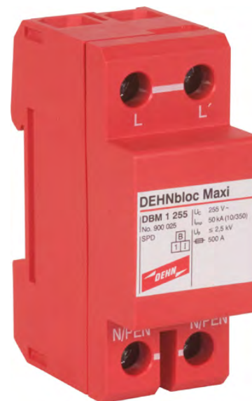
DBM 1 255 nr kat. 900 025