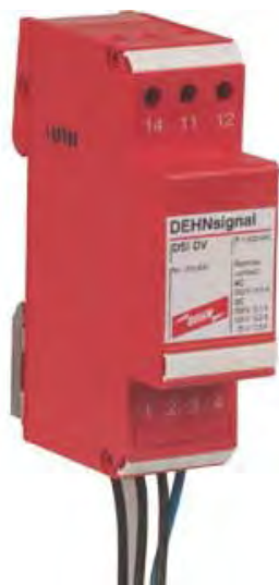
DSI DV nr kat. 910 620