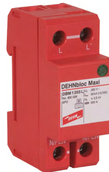
DBM 1 255 L nr kat. 900 026