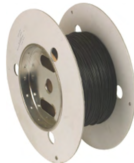
LWL DSI nr kat. 910 640