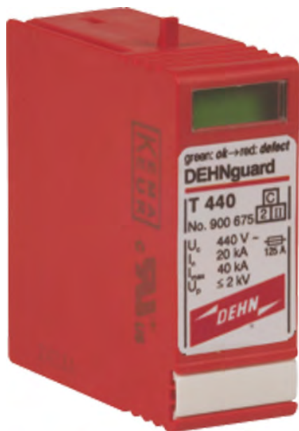
T 440 nr kat. 900 675