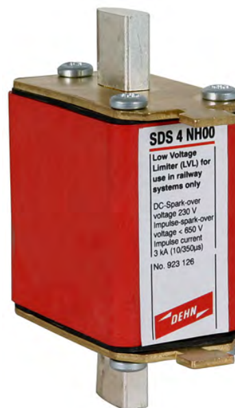
SDS 4 NH00 nr kat. 923 126