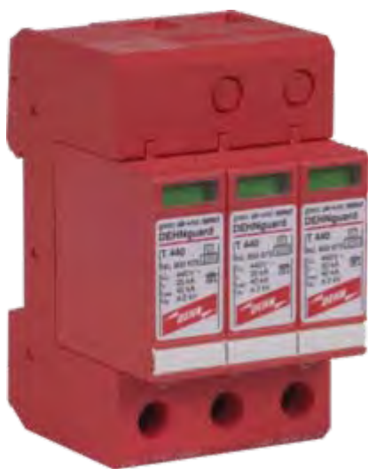
DG Y PV 1000 nr kat. 900 517