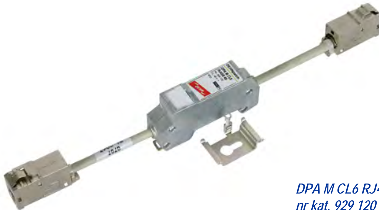
DPA M CL6 RJ45B 48 nr kat. 929 120