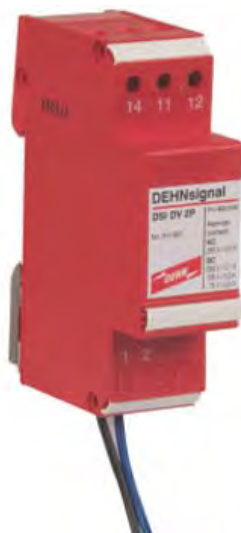
DSI DV 2P nr kat. 910 621