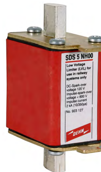
SDS 5 NH00 nr kat. 923 125