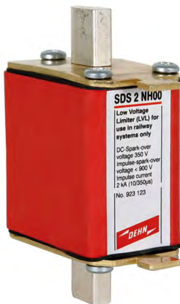
SDS 2 NH00 nr kat. 923 123