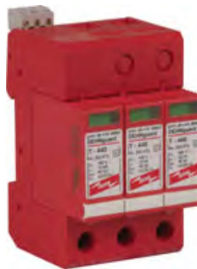
DG Y PV 1000 FM nr kat. 900 547