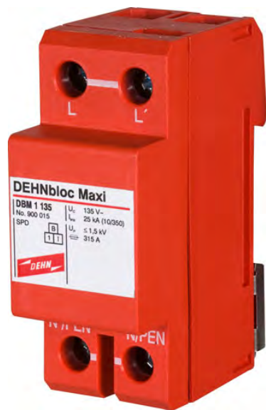
DBM 1 135 nr kat. 900 015