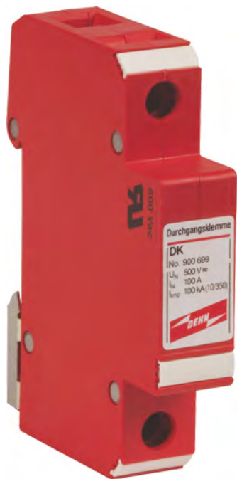
zwora przelotowa DK DK 35 nr kat 900 699