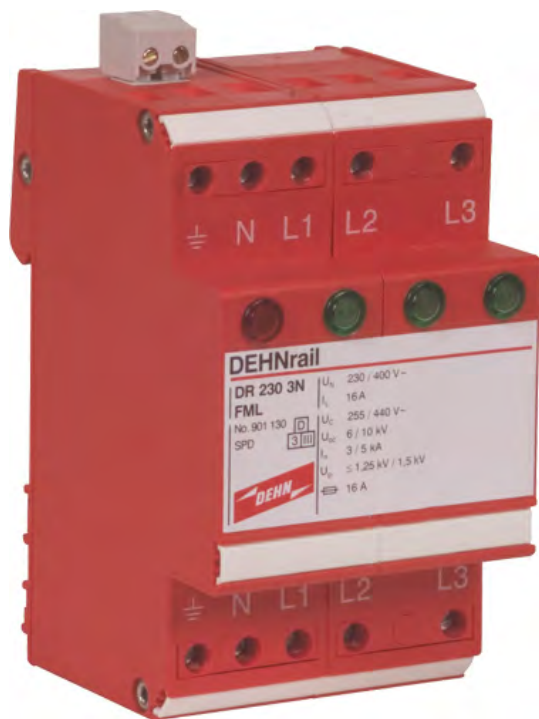
DR 230 3N FML nr kat 901 130