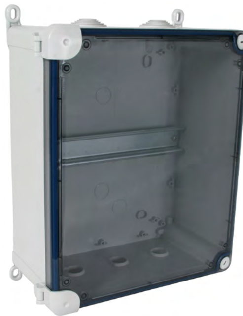
obudowa izolacyjna IP55 IGA 10 IP55 nr kat 902 480