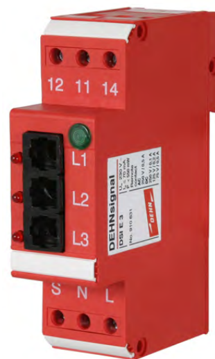
DSI E3 nr kat. 910 631